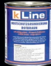
SERVICE- UND WERKSTATTPRODUKTE