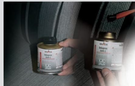
Verkleben von Textilien und Filz auf Metall/Holz/Kunststoff