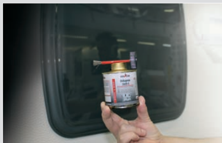
Tragen Sie Dekapren 3649-2 mit dem beiliegenden Pinsel auf