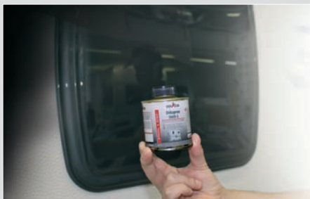
Zur Verwendung für Wohnwagen & Reisemobile